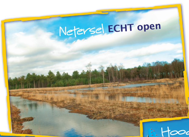
Netersel ECHT open