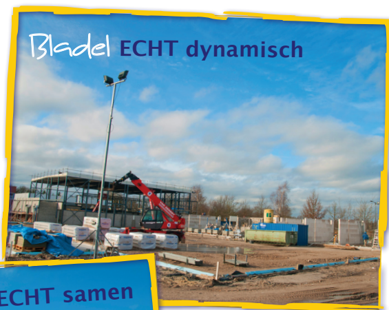
Bladel ECHT dynamisch