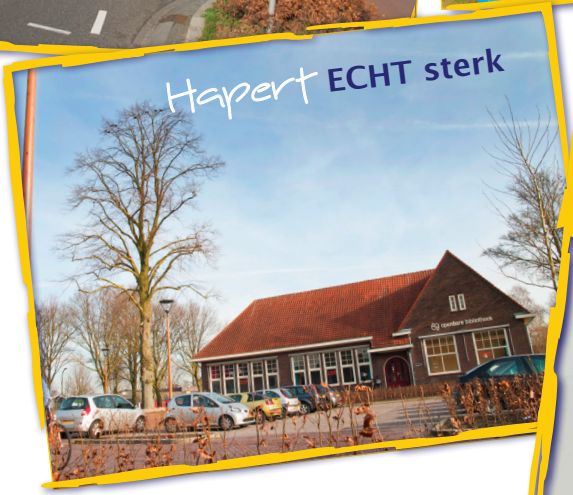
Hapert ECHT sterk