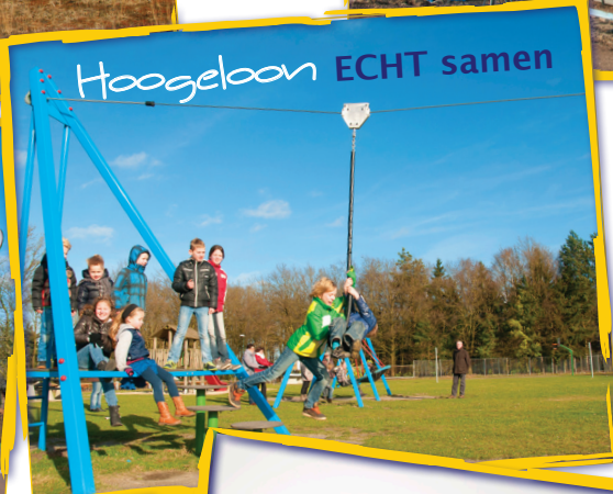
Hoogeloon ECHT samen