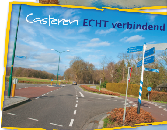
Casteren ECHT verbindend